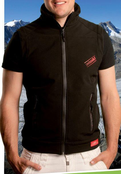
Daniel Albrecht Ski-Weltmeister